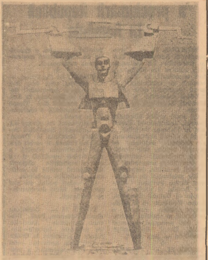
Prometeu se întoarce la Soare DOSARUL ENERGETICII MONDIALE

pectele negative care frînează bunul mers al producției, s-au criticat curajul actelor de indisciplină, absențele nemotivate, ușurința cu care se eliberează certificatele de boală de către unele cadre medicale, rispa de combustibil și energie, de materiale și materii prime, rebuturile, starea necorespunzătoare a unor drumuri din municipiul, ciubucurile, etc.