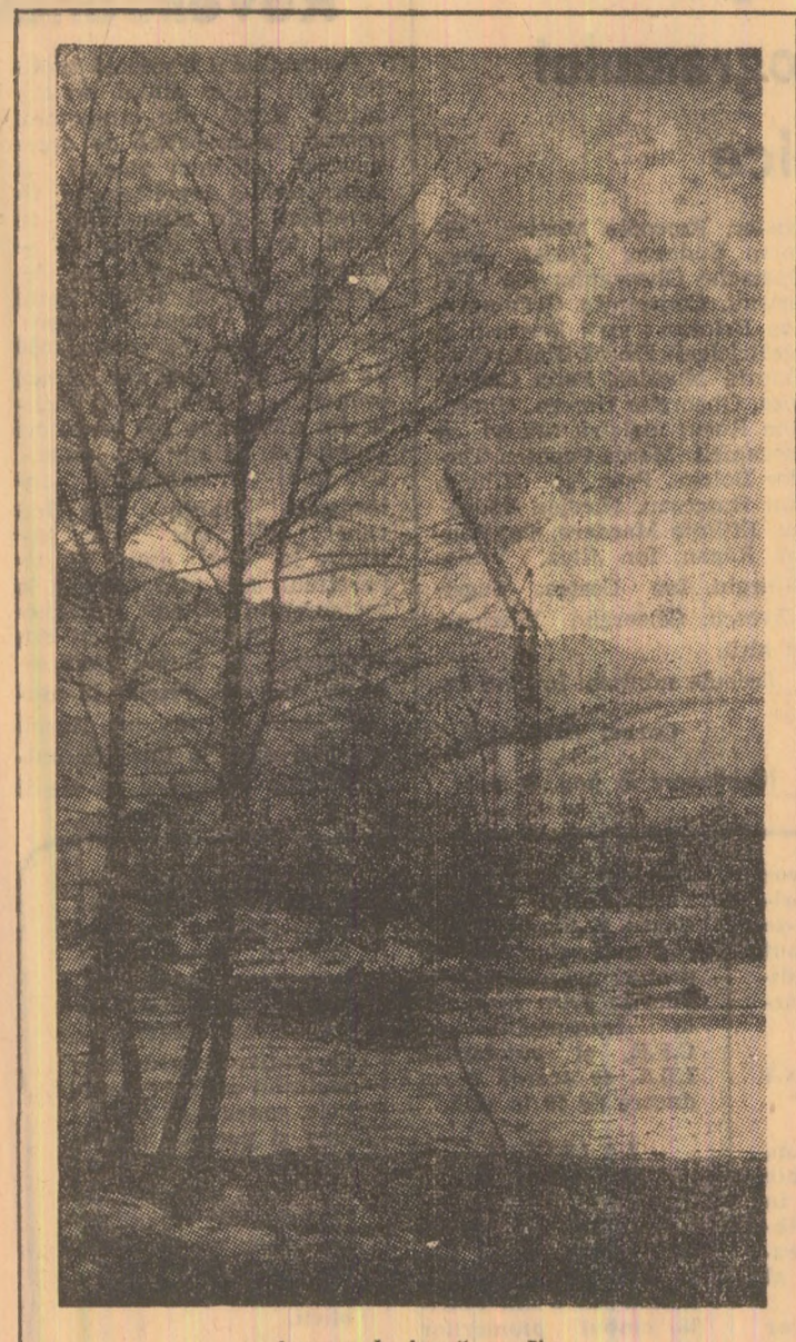
Amurg de iarnă pe Jiu.

Prin forța împrejurărilor, am fost sîntit cum de multă vreme autobuzelor, așteptările în stații, inechităților pe care din cînd în cînd le poți evita prin ocuparea unui miraculos loc liber, mă rog, întregii game de probleme pe care le ridică navetismul. Pot spune că sînt un navetist blazat: mă urch în autobuz întînd cu un gest mecanic banii taxatuarilor, îmi iau biletul, sînt ca un punct de stație de sprîjină și mă cufund în glădușile mele pînă la stația de destinație, uitînd complet de cele ce se întîmplă în jur. Cred că aceasta ar fi fost evoluția lucrurilor și în dimineața aceea de început de decembrie cînd m-am urcat la stația Tunel — Petrița în autobuzul care circula pe ruta Petrița — Aeroport. Același drum făcut de foarte multe ori de la „Tunel” pînă în Piața Victoriei. Am fost însă smuls din reveria mea de fiecare dimineață de glasul politicos, dar autoritar al taxatuarilor. — Dumeavoastră, vă rog să-mi dați un leu pînă în Piața Victoriei și nu 50 de bani. Știu că ați mai călătorit cu 50 de bani, dar să știți că tariful este un leu... Am achitat în grabă leul solicitat, dar convingerea mea intimă a rămas că taxatuarul greșea și nicicum nu. Consultînd la sediul E.G.C. Petroșani tarifele în vigoare am constatat cu sur-