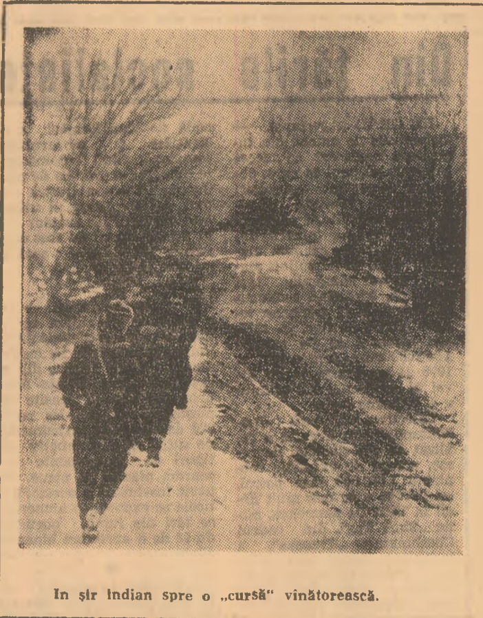
În șir indian spre o „cursă” vinătorească.

Pentru aceasta va trebui adoptat un stil de muncă viu, dinamic, eficient care să corespundă noilor sarcini și condiții de la mina Urlicani. Numai așa însășiunile stabilite pentru activitatea viitoare a comunistilor vor căpăta eficiență și finalitate.