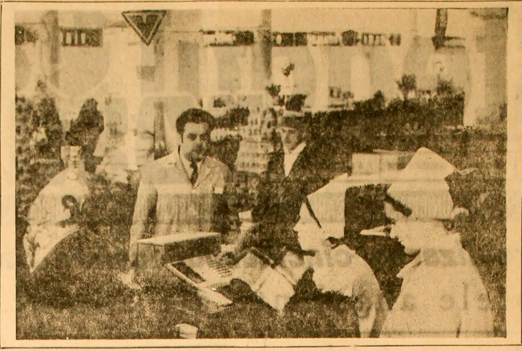
Magazinul de autoservire din cadrul complexului comercial al Vulcanului.

Magazinul de autoservire din cadrul complexului comercial al Vulcanului, a început să funcționeze în mod normal în ziua de ieri. Acest magazin este primul de acest fel din zona și va servi intereselor consumatorilor din zona și din împrejurimi.