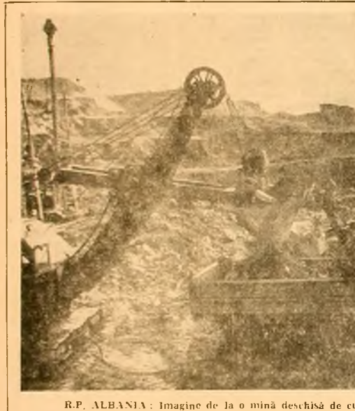
R.P. ALBANIA: Imagine de la o mină deschisă de cupru din districtul Kukës.