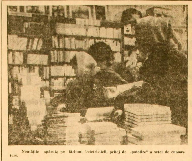
Noutățile aparute pe lărmimul beletisticii, prilej de „potolire” a setei de cunoaștere.