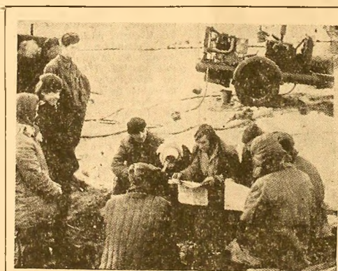
În timpul pauzei de masă lucrătorii din echipa de săpători a I.L.H.S. Sectorul Livezeni le mai rămîne și vreme pentru răsofiera ultimelor noutăți apărute în presă.