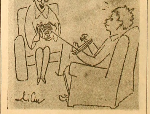
Mama: — Dacă nu-ți convine ora de sport, te duci la medic, spui și tu că te supără capul, inima, el îți dă scutire, tu vii acasă și m-ajută pe mine... Copilul: — Și, e bine?... V. TEODORESCU

Marți, în jurul orei 13, pe artera principală a orașului Vulcan (mai precis, pe porțiunea dintre Liceu și Școala generală nr. 5), trecea în marș goană un autocamion al salubrității orașului, supraincercat. Nu l-am reținut numărul. Am reținut în schimb faptul că, de sus, de pe „cupa” de gunoi, un salariat al E.G.C. zîmbea condescendent pietonilor, făcîndu-le din cînd în cînd și semne de... „bun rîmas”. Motivul? Omul era, pesemne, foarte încîntat de faptul că, aidoma copilului