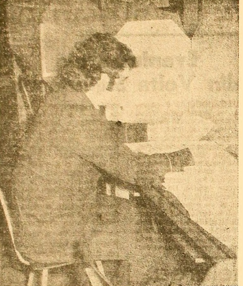
Cartea — izvor prețios de informații... Foto: Mișcă MITUCA