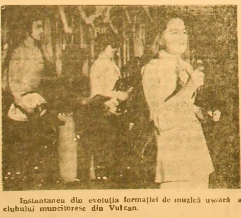
Instantaneu din evoluția formației de muzică ușoară a clubului muncitoresc din Vulcan.