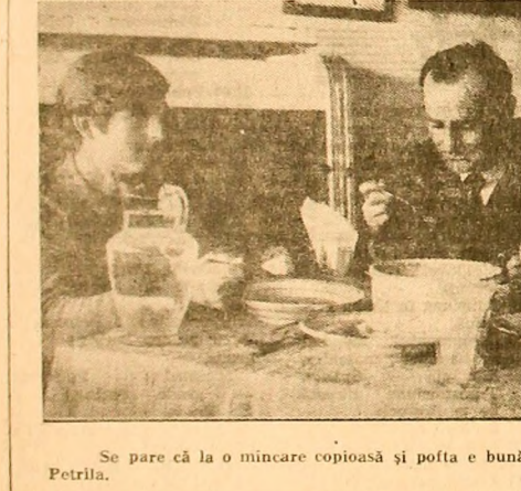
Se pare că la o mîncare copioasă și poftă e bună! Instantaneu de la cantina E.M. Petrița.