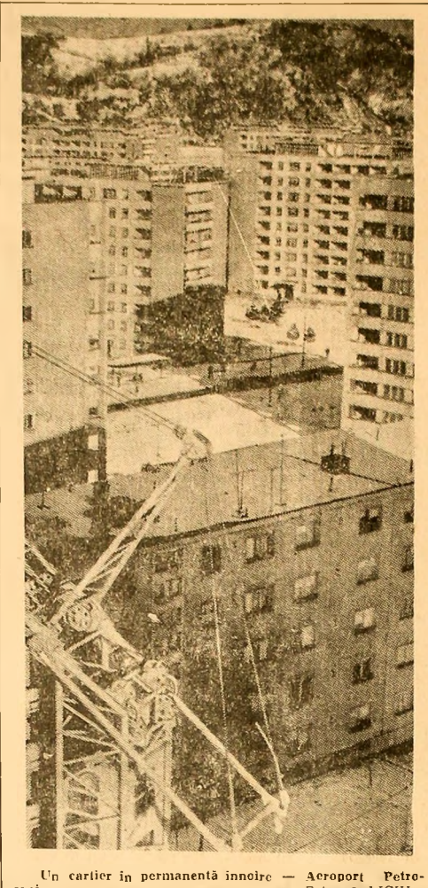
Un cartier în permanentă înnoire — Aeroportul Petroșani.