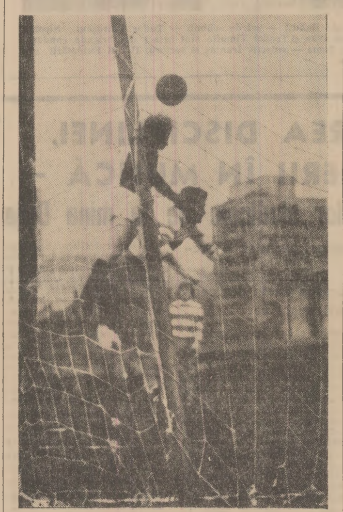
Roznai se „înaltă”, își depășește adversarul dar șutează peste bară...