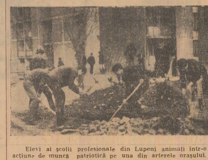
Elevii ai școlii profesionale din Lupeni animați într-o acțiune de muncă patriotică pe una din arterele orașului.