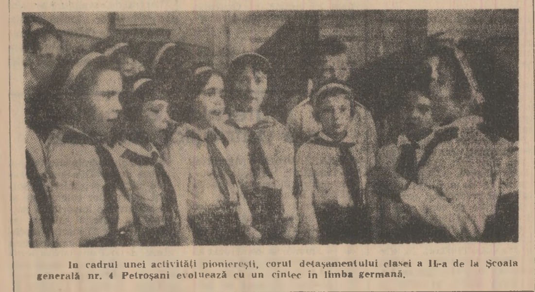
În cadrul unei activități pionieresti, corul detașamentului clasei a II-a de la Școala generală nr. 4 Petroșani evoluează cu un cîntec în limba germană.

Filmul lui Forbes este foarte bine făcut, am putea spune că este impecabil din punct de vedere profesional. Imaginea, compusă excelent de cameraman-ul Tony Imi; dialogurile liresc, lezile de orice tenăție literarizantă, muzica expresivă a lui Stanley Myers, au o netă înțelegere dramatică. Accentuăm aceste lucruri deoarece grație lor apare credibilă, elaborată cu gust și fără artificii, o poveste de dragoste dintre doi infirmi. La acest capitol se oferă de la sine posibilitatea unei noi analogii, de această dată cu celebra „Love Story”. Ca și acolo, în „Luna furioasă” ierierica este de scurtă durată, prin dispariția prematură a eroinei. În contextul în care iubirea este o sansă de supraviețuire, dezamăgimintul trist, are zgăritoare reverberații. Cumilul Malcolm McDowell — Nanelle Newman este excelent în acest film care ne atenționează că dezmăstările soarelui nu au nevoie de mila noastră, ci de un ajutor real, atunci de acea minie ce aruncă o punte a înțelegerii peste prăpastia dintre destine diferite. Al. COVACI