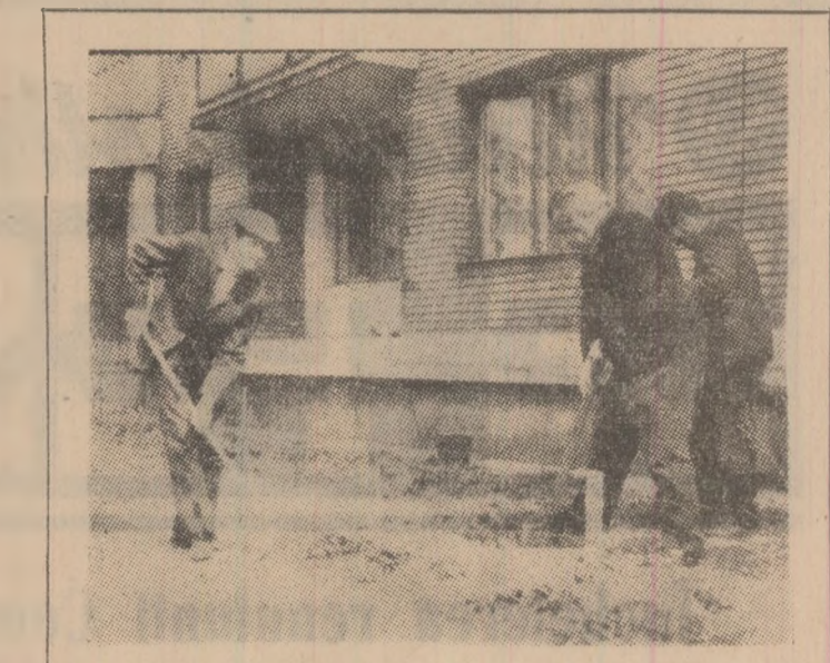
„O dimineață de duminică cu soare, la fel ca oricare alta, și toțiș pufin diferit. Locul clipeilor de odihnă „pasivă” la sîrșitul unei săptămîni de muncă, a fost luat pentru câteva ore de o odihnă activă, de activitatea obștească în care dorința de a contribui la crearea irumosului în cartierele orașului a fost deîntîlcită pentru tot ceea ce s-a făcut.