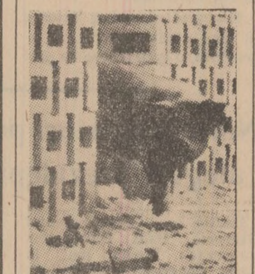
Au venit „ajutoarele”... Decamdata, nesingherie, fac ce vor.

În scopul remedierii neajunsurilor manifestate, pentru îmbunătățirea în continuare a dezbaterilor politico-ideologice, cit și pentru asigurarea înclinderii în bune condiții a activității din acest an și a pregătirii corespunzătoare a noului an de învățămînt 1974—1975, biroul comitetului municipal de partid a adoptat o serie de măsuri. Intre acest-