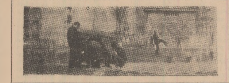
Si toțiș timp avem destul. Avem chiar și să risipim, ba la o tablă, ba la un șeptic. Las' să lucreze alții...

„O dimineață de duminică cu soare, la fel ca oricare alta, și toțiș pufin diferit. Locul clipeilor de odihnă „pasivă” la sîrșitul unei săptămîni de muncă, a fost luat pentru câteva ore de o odihnă activă, de activitatea obștească în care dorința de a contribui la crearea irumosului în cartierele orașului a fost deîntîlcită pentru tot ceea ce s-a făcut.