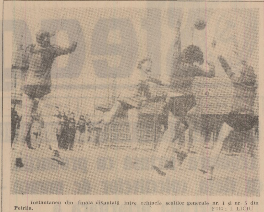
Instantaneu din finala disputată între echipele școlilor generale nr. 1 și nr. 5 din Petrlia.