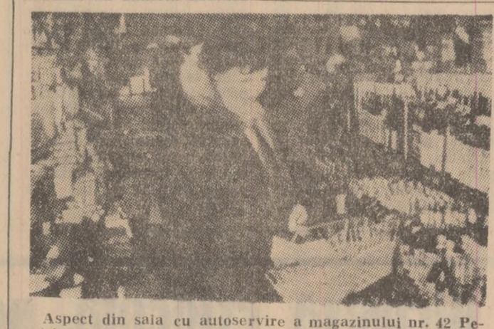
Aspect din sala cu autoservire a magazinului nr. 42 Petrila.