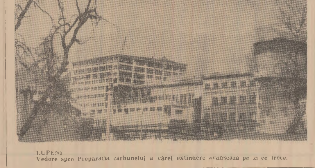
LUPENI. Vedere spre Preparatiua carbunelui a cărei extindere avansează pe zi ce trece.