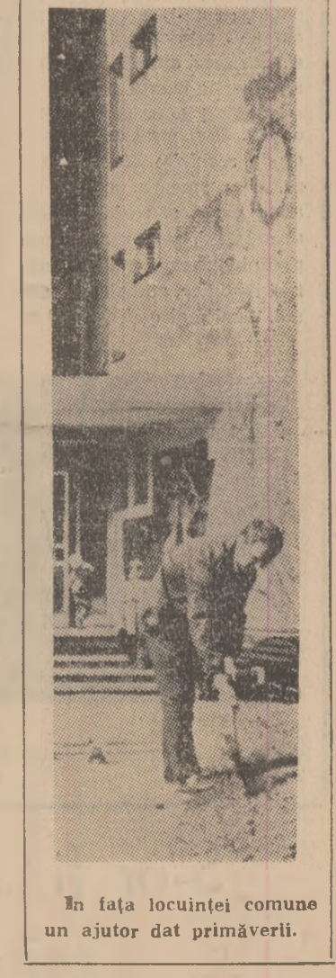
În fața locuinței comune un ajutor dat primăverii.