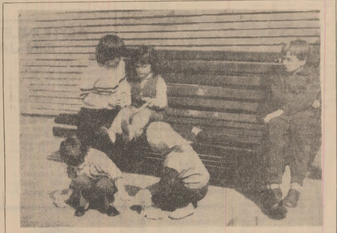
Bucuria celor mici — Soarele