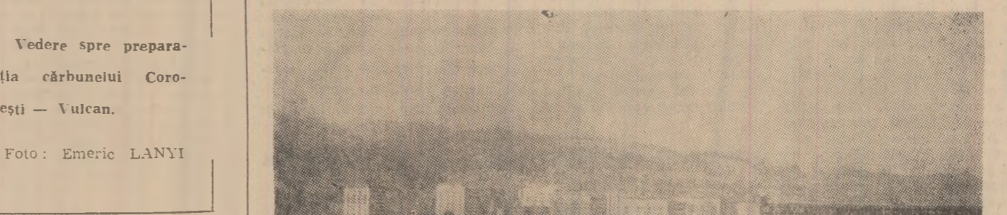
Vedere spre preparatiile cărbunelui Coroesti — Vulcan.

Și în sfera comerțului, ca și în întreaga viață socială, se impune sporirea preocupărilor pentru modernizarea activității de servicii a publicului consumator. Pornind de la acest deziderat, Grupul școlar comercial din Petrosani, care pregătește lucrători pentru județele Hunedoara și Gorj (cursuri de zi, ucenicie la locul de muncă și cursuri postliceale), a organizat, recent, un schimb de experiență axat pe problematica practicii în unitățile comerciale și integrarea absolvenților în muncă. Pentru câteva ore, numeroși conducători ai întreprinderilor comerciale, lucrători din comerț, cadre didactice ale școlii și-au lăsat deoparte preocupările cotidiene în folosul altele de evident interes: găsirea de noi soluții, de noi modalități și metode pentru perfecționarea activității comerciale, pentru a ușura pătrunderea noului — asemilat pe băncile școlii — în magazine, odată cu tinerii absolvenți. Inceputul discuțiilor a fost făcut de tovarășul Gheorghe Ana, directorul grupului școlar comercial care a vorbit pe larg despre experiența acumulată, făcînd referiri la neajunsurile întâmpinate în practica elevilor, ca și în întreaga lor muncă, după absolvirea