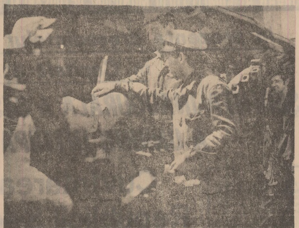
Prima cunoștință cu noul utilaj se face încă de la suprafață, unde sînt analizate în amănunțime toate detaliile, piesele, întregul angrenaj.

O meserie de perspectivă, frumoasă, care prezintă interes, care atrage!