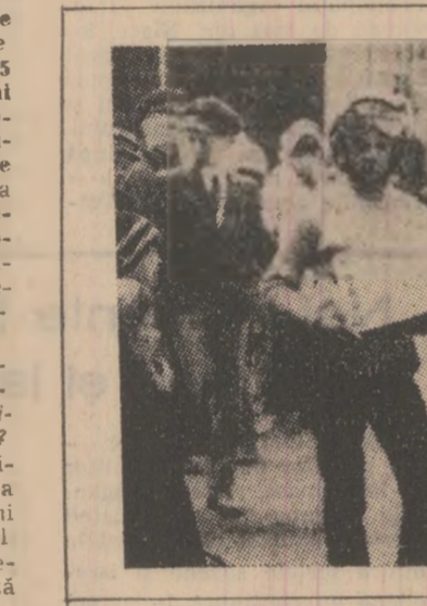
Mult îndrăgite și frecventate de către elevi, în zilele vacanței, sint activitățile sportive desfășurate în aer liber. Cliseul de mai sus înfățișează un moment semnificativ. Cîștigătorii concursului de carturi desfășurat la Vulcan, care s-a bucurat de o entuziastă participare a pionierilor.

lui a efectuat o analiză exigentă a situației realizării sarcinilor la fiecare șantier. Concluziile reieșite conduc la necesitatea ca organizațiile de partid de pe șantiere să intervină cu competență pentru impulsionarea ritmului de execuție la fiecare punct de lucru. Responsabilități de lucrări, cei care coordonează activitatea urmează să revizuiască