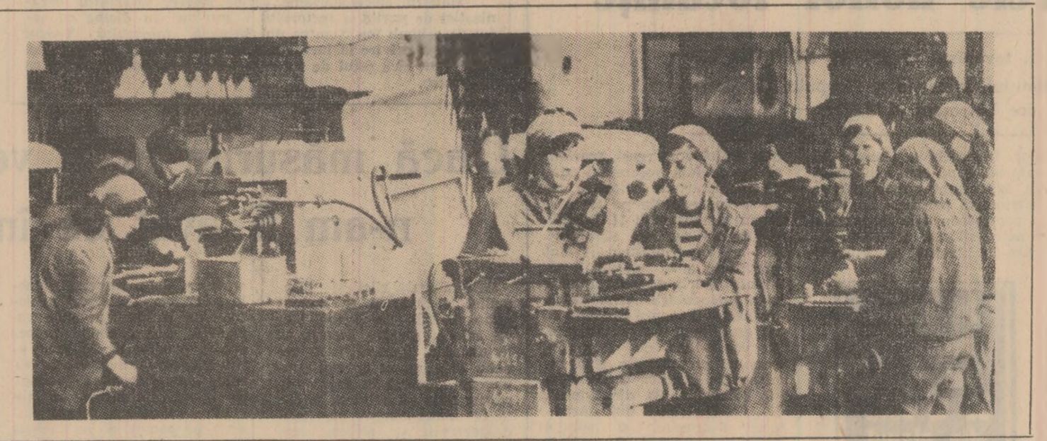
Un grup de muncitori din mina Paroșeni.