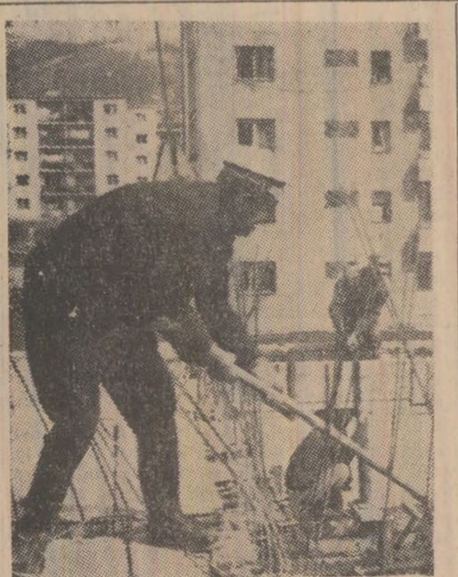
În cartierul Aeroport Petroșani, ca de altfel în întreg municipiul, se construiesc mereu.