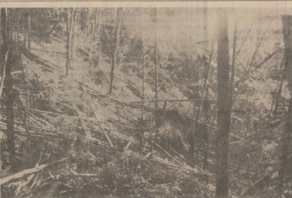
Risipă, în loc de bogăție!