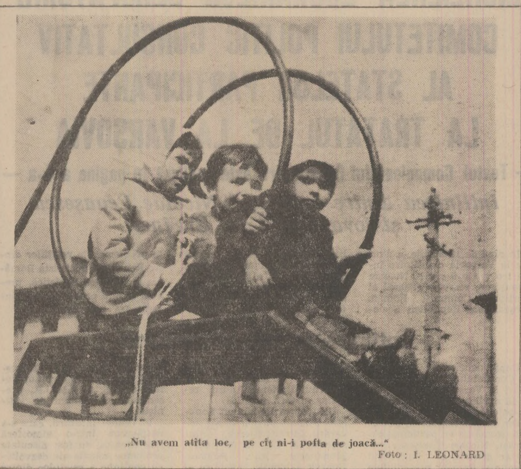
„Nu avem altă loc, pe cîț ni-i pofta de joacă...”

Avesta fiind situația, se impune stabilirea urgentă a executanților lucrării, după care, în scurt timp, să se atingă un ritm de execuție accelerat. Este o necesitate stringentă, o cerință socială expresă reclamată de condițiile existente în cartierul Aeroport din Petroșani. Toți cei care locuiesc aici doresc să aibă în apartamentele lor apă, chiar și la etajele superioare ale blocurilor.