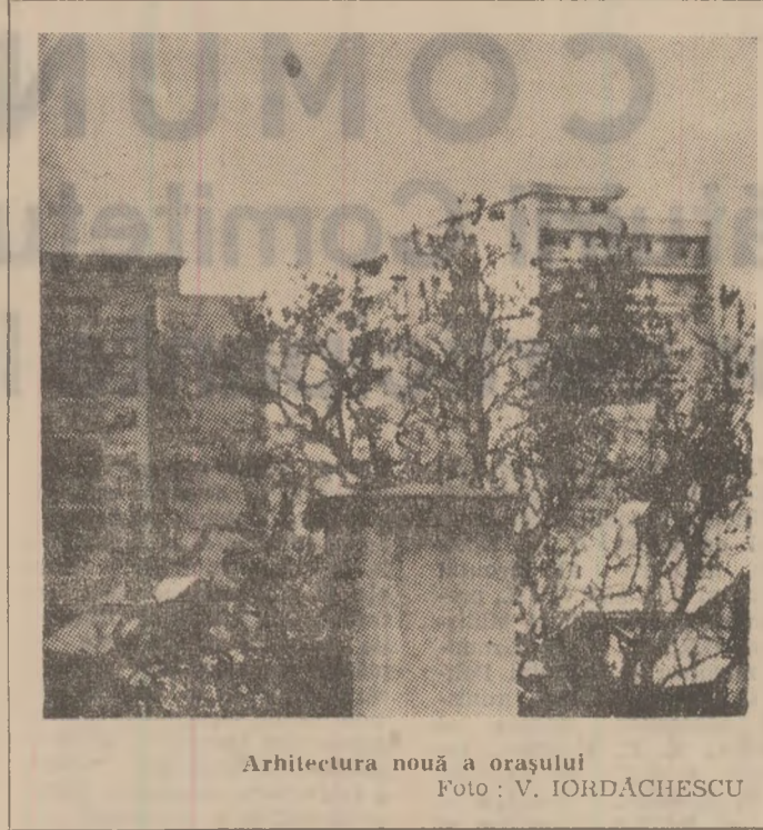
Arhitectura nouă a orașului

magnetită, spălarea claselor granulometrice mari de cărbune prin zăvoi, realizarea unui decantor pentru curățarea apelor reziduale, cu acționare periferică, la un diametru de 50 de metri. Toate aceste soluții tehnice moderne vor contribui la mai buna valorificare a producției de cărbune coeficientă la Văii Jiului, în condiții de eficiență economică sporită.