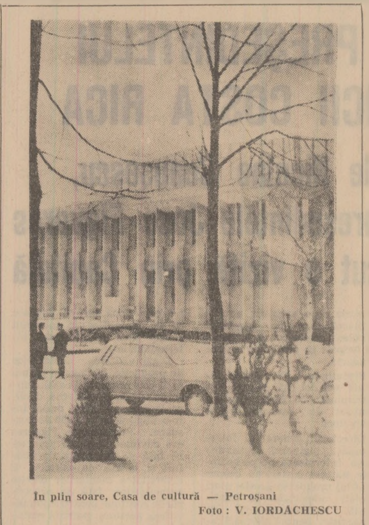
În plin soare, Casa de cultură — Petrosani.