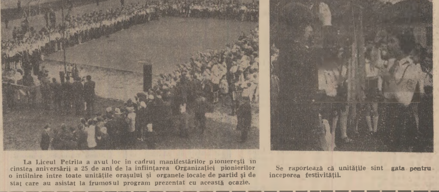
La Liceul Petrița a avut loc în cadrul manifestărilor pionieresti în cinstea aniversării a 25 de ani de la înființarea Organizației pionierilor o întîlnire între toate unitățile orașului și organele locale de partid și de stat care au asistat la frumosul program prezentat cu această ocazie.

ani cînd minerii, toți oamenii muncii din Valea Jiului, alături de întregul nostru popor, obțin rezultate constant superioare în întrecerea socialistă pentru realizarea cincinalului înainte de termen, pionierii și școlarii se află integrați cu eficiență în această activitate rodnică. Inițiativa și faptele pionieresti din municipiu — întîlniri cu muncitori, activități de partid și de stat, vizite în întreprinderi, participări fructuoase la muncă patriotică, rezultatele bune la învățătură și alte componente ale cotidianului în viața de organizație — sintetizează educația în spiritul (Continuare în pag. a 3-a)