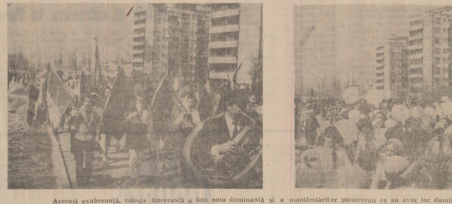
Aceeași exuberanță, vioaie tinerescă a fost nota dominantă și a manifestărilor pionieresti...