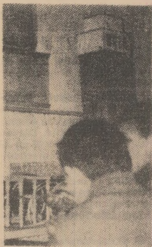
Pionieri de la cercul „Micii mineri” confecționînd o machetă.