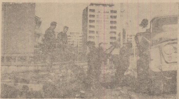
Lucrări de modernizare în Vulcan. Străzile principale sînt lărgite și pavate. În acțiune: lucrătorii E.G.C.

Pentru această abatere gravă, conducerea întreprinderii ne-a comunicat măsura luată: desfacerea contractului de muncă.