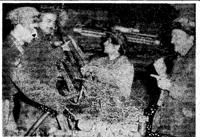
E. M. Lupeni. Mașina de perforat BUR, sprijin eficient în sporirea vitezelor de înaintare la lucrările de deschideri, ilustrează continua creștere a nivelului de dotare tehnică a locurilor de muncă în subteran.

Pentru că oamenii lui Giț și Nicoadă răspund prin fapte la această mobilizatoare chemare a conducerii partidului.