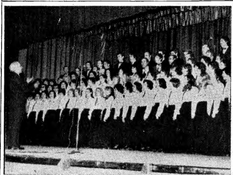
Un moment din evoluția corului sindicatelor din Lupeni.

În cadrul expoziției de pictură „Ex libris” organizată în sala bibliotecii clubului muncitoresc Lupeni au fost expuse colecții aparținînd pictorilor Iosif Tellmann și Dafinel Duinea. Cercul de artă plastică din cadrul acestui club pregătește asiduu o expoziție ce va prezenta portrete ale fruntașilor în producție.