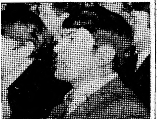
tid, față de tovarășul Nicolae Ceaușescu.

organizațiile nerilor, a ce- subliniat că e lucru unde ile noi, două t comuniști rganizațiilor lor tehnice, colectiv se ngajamentele urind, se în- ă.șului VID