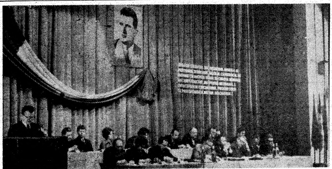
Prezidiul în timpul lucrărilor conferinței.

Simbătă, 19 martie a.c., în sala mare a Casei de cultură din Petroșani a avut loc Conferința organizației municipale de partid pentru dare de seamă și alegeri.