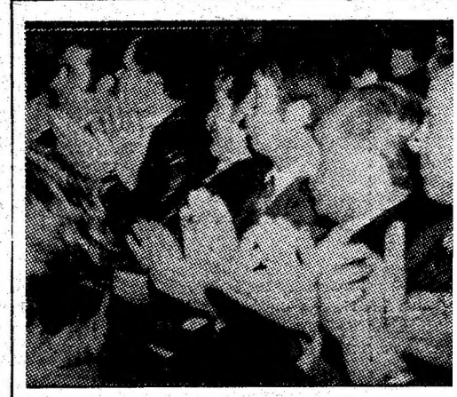
Adeziune deplină, atașament fierbînt

munci mai mult, mai bine și cu demnitate pentru traducerea în viață a politicii partidului.