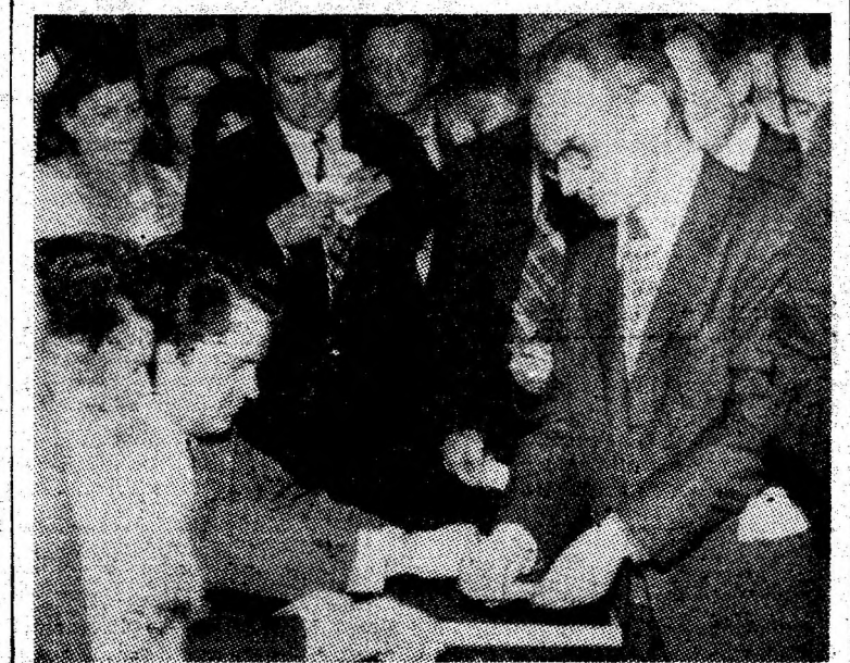
Delegații își exercită dreptul de vot.

În fața municipiului nostru stau sarcini mari izvorîte din prevederile actualului plan cincinal, sarcini menite să ducă la dezvoltarea economică-socială a tuturor localităților, se vor soluționa multe din problemele