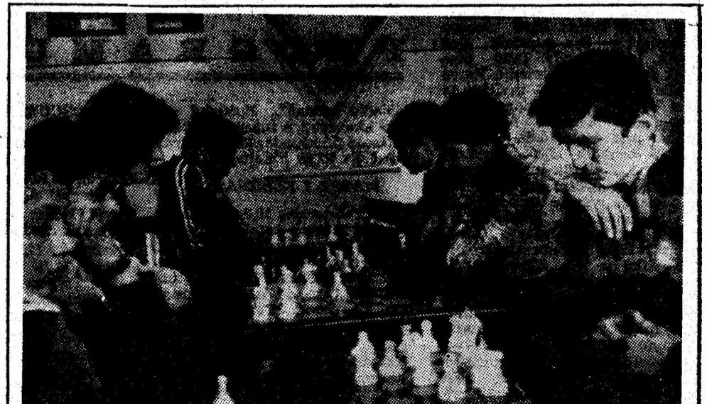
Așa după cum am anunțat în ziar, Casa pionierilor din Petroșani a găzduit întrecerile de șah ale elevilor pentru desemnarea campionilor municipali din cadrul „Daciadei”. În clișeu de față, cîțiva dintre protagoniștii întrecerii.

du-se excelent, cinci dintre ei au trăit satisfacția de a cuceri laurii victoriei, printre cei care au ocupat locul I, la categoriile lor de greutate, fiind și Gheorghe Fluture (54 kg), Mircea Negru (57), Ion Geică (60), Dănuț Adochiței (63, 50) și Drăghici Porumbită (51). Intr-o altă întîlnire amicală garnitura Jiului a întrecut formația pugiliștilor de la Voința Deva cu scorul de 18—4. (S. BALOI)