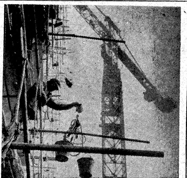
Se înalță noi „turnuri” de locuințe în municipiul nostru.