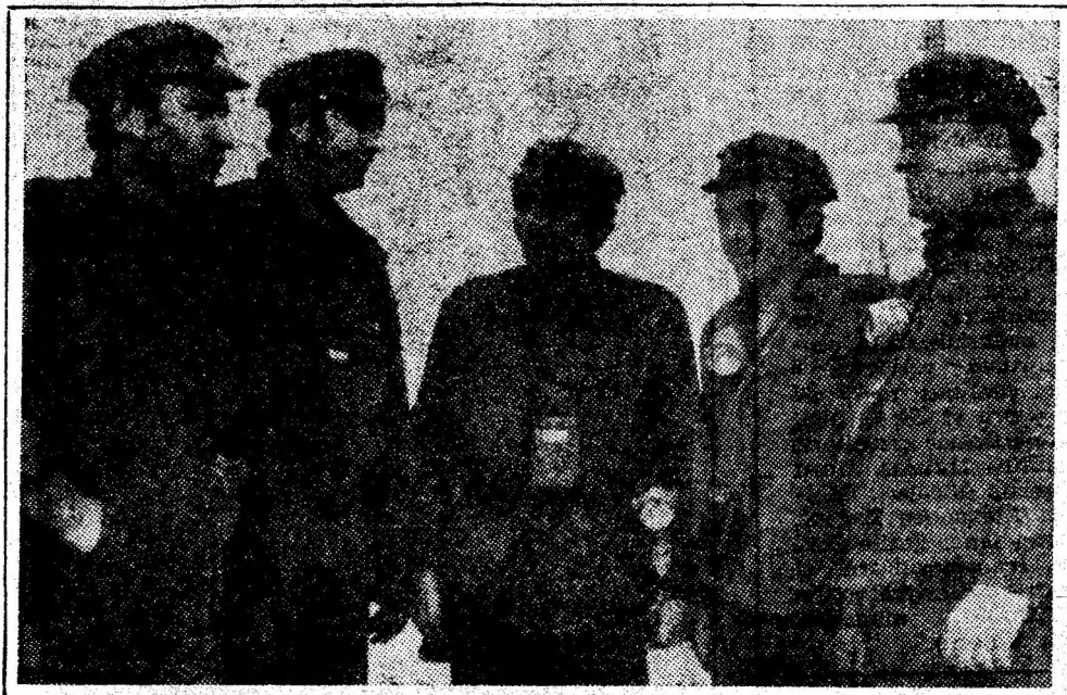
Un scurt consult tehnic între maistrii minierii ai minei Livezeni, înaintea intrării în schimbul II.