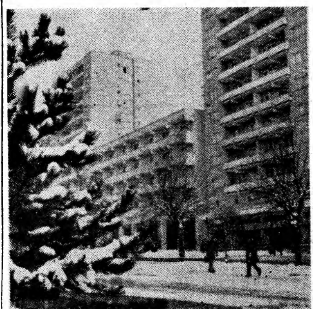
Secvență de iarnă