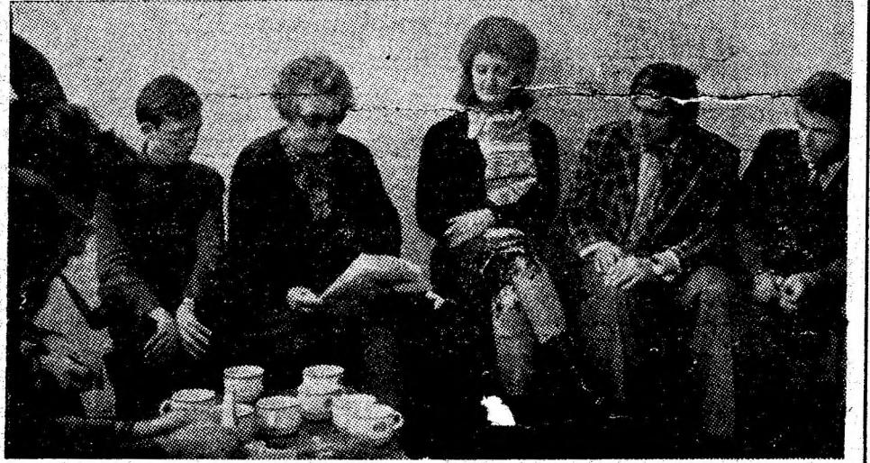
Instantaneu dintr-o ședință a ceneclului „Panait Istrati” de la Casa de cultură din Petroșani.