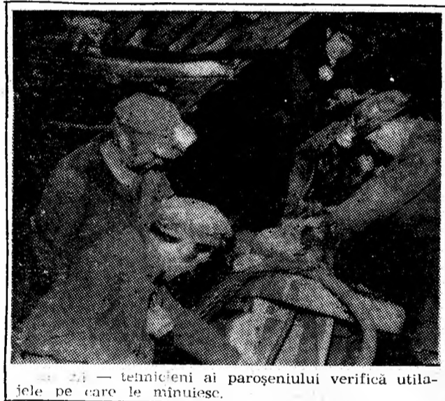
— tehnicieni ai paroșeniului verifică utilajele pe care le mînuiesc.

Întreprinderea minieră Petrița, mină dotată cu un complex mecanizat de abataj (SMS-3) — de concepție și construcție indigenă — ne oferă o experiență de natură organizatorică ce vizează nu numai asigurarea asistenței tehnice pe perioada funcționării utilajului ci și organizarea activității legate de dezchiderea, revizuirea, repararea și reintroducerea acestui complex la frontul de lucru.