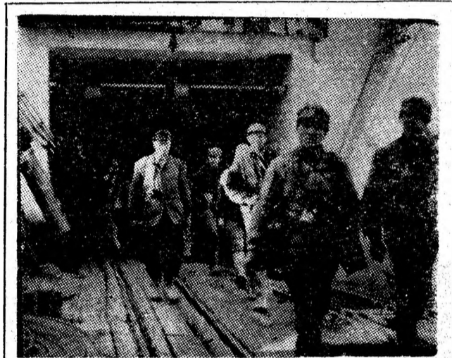
S-a terminat șutul la I.M. Dîlja.