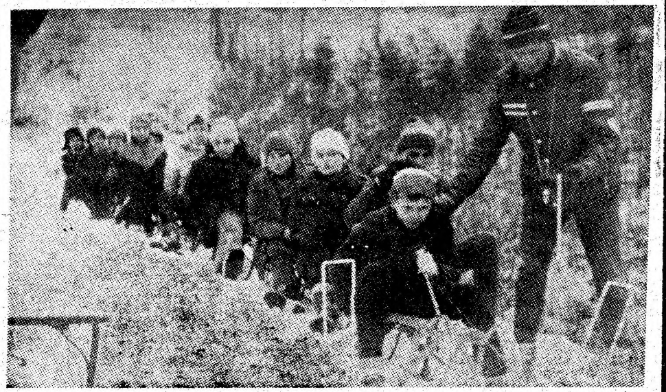
Aspect de la etapa municipală la sanie, categoria 10-14 ani, întrecere ce s-a desfășurat recent pe pîrtia de la Aninoasa.

martie : F.C. Bihor — A.S.A. Tg. Mureș, Dinamo — Politehnica Iași, U. Craiova — Politehnica Timișoara, Jiul Petroșani — Steaua, F.C. Petrolul — F.C.M. Reșița, F.C. Olimpia — S.C. Bacău, F.C. Argeș — F.C. Corvinul, C.S. Tirgoviște — U.T. Arad, F.C. Constanța — Sportul studentesc.