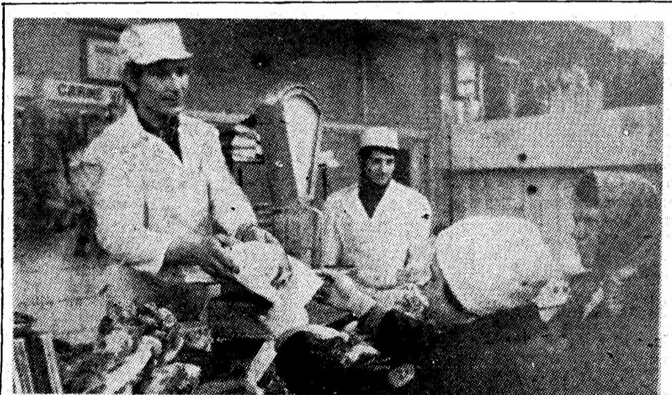
Complexul alimentară „Mercur” Vulcan. Datorită bunei aprovizionări a unității și atitudinii pline de simpatie a personalului față de cumpărători, complexul se bucură de un bun renume în rîndul cetățenilor cartierului.