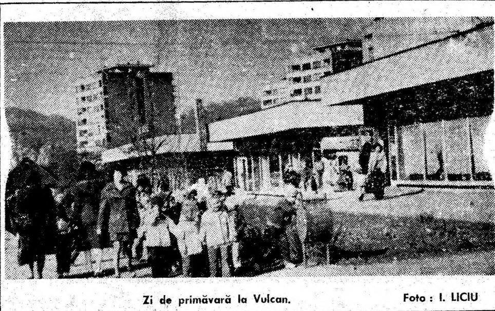
Zi de primăvară la Vulcan.