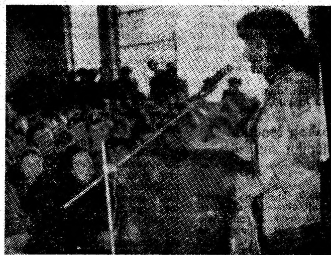
Actrița Stela Popescu în mijlocul minerilor de la Lonea.

● La Deva o reprezentație cu piesa „Musafirlor care n-au sunat la ușă” de J. Calvo — Sotelo.