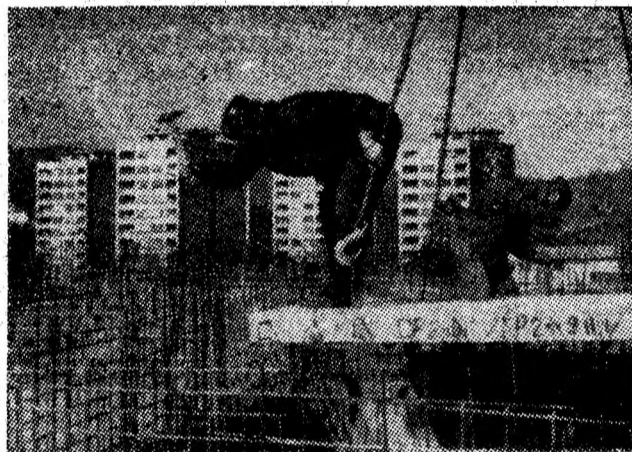
Blocul M-1 cu magazine la parter, care se înalță în viitorul centru civic al Vulcanului va fi dat în folosință în acest an și va cuprinde 96 apartamente.