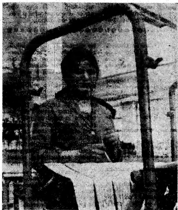
Fabrica de fire artificiale „Viscoza” Lupeni.

Sectorul IV al I.M. Lonea cu o mare pondere la producția întreprinderii, a depășit grevițiile din lunile precedente, și prin rezultatele acestei luni confirmă hotărîrea minerilor, ca odată cu raționalizarea transportului în sector, să desfășoare în abataje o activitate neîntreruptă, rodnică.