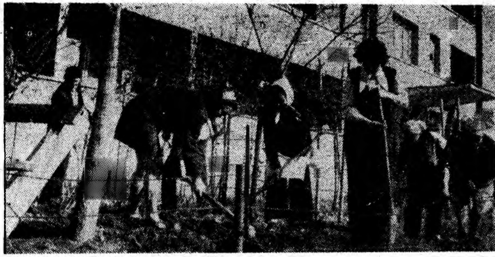
La blocul D3 din bulevardul Victoriei Vulcan, locatarii au ieșit la primirea spațiului verde din împrejurimi.