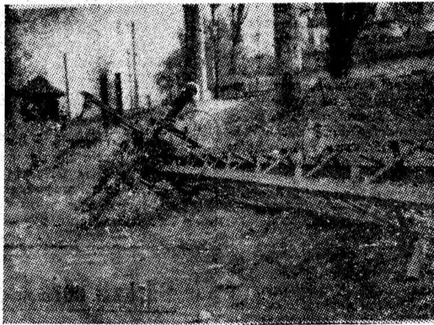
A trecut o lună de cînd acest stîlp metalic a fost tăiat și pus paralel cu linia ferată, de muncitori de la S.D.E.E. Petroșani.