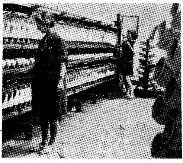
60 de fire micronice se împletesc într-un fir al celor 6 000 de rotații pe minut.