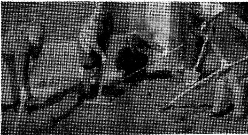
Acțiunile de primăvară au început să cunoască o tot mai viguroasă animație. Instantaneul nostru peșină doar un crîmpei din această animație: locatarii blocului F-7 din Vulcan își amenajează viitoarele ronduri de flori de sub ferestrele apartamentelor.

Gheorghită ACASANDREI, responsabilul blocului 8, strada M. Eminescu, Vulcan