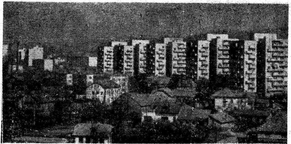
Verticalele „turnurilor” de locuit ale Petroșaniului de azi au pus o amenințare nouă asupra orașului de odinioară.