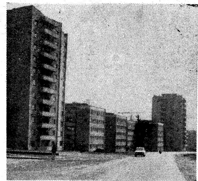
Aeroport Petroșani, un cartier în plină dezvoltare.

Intrecuse măsura într-una din unitățile de alimentație publică din Uricani. Cu mintea tulburată de alcool, n-a mai fost