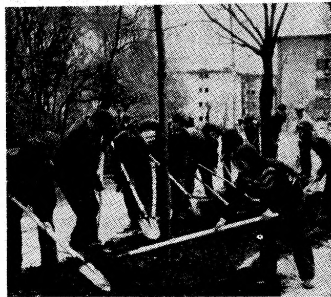
Liceul din Petroșani amenajează ronduri de pe strada Independenței.