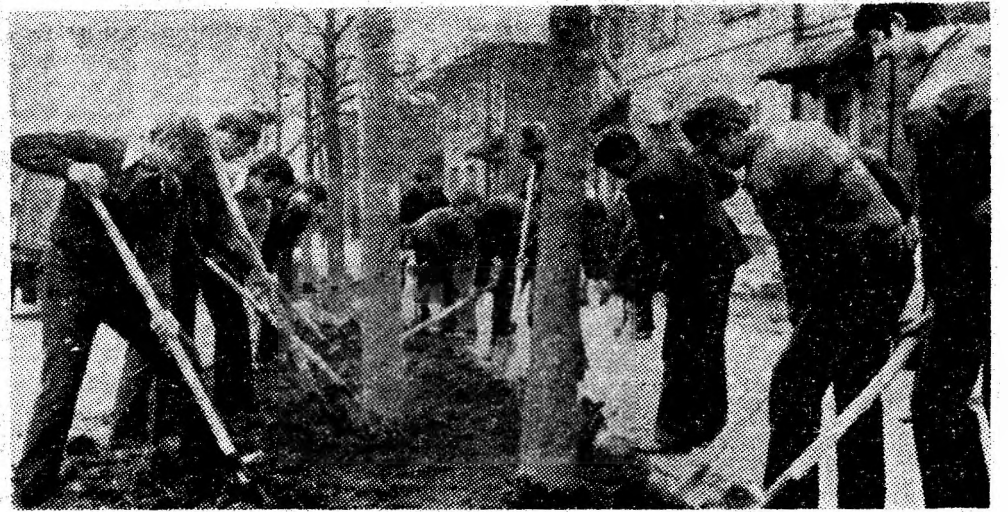
Pe strada Republicii din Petroșani și elevii Liceului industrial minier își aduc o contribuție de seamă la înfrumusețarea citadină.

Sabin ROMAN, mastru instructor, Școala generală nr. 5 Vulcan