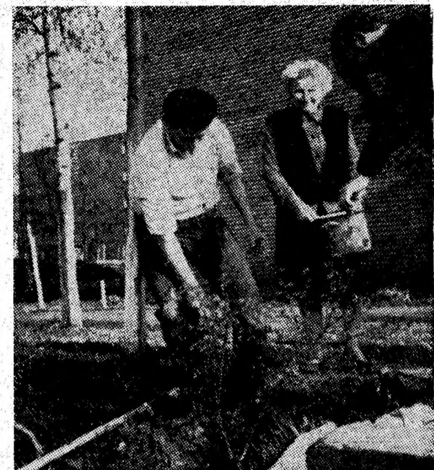
La blocul 24 de pe strada Independenței, locatarii s-au descurtat cu un gard viu care va contribui la înfrumusețarea acestei mari artere de circulație a cartierului Aeroport - Petrosani.