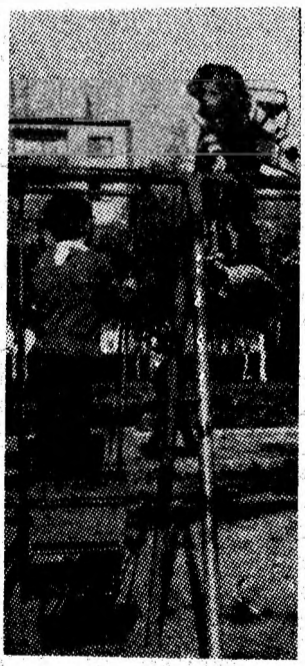
Instalațiile de joacă pentru copii - mult solicitate în toate cartierele.