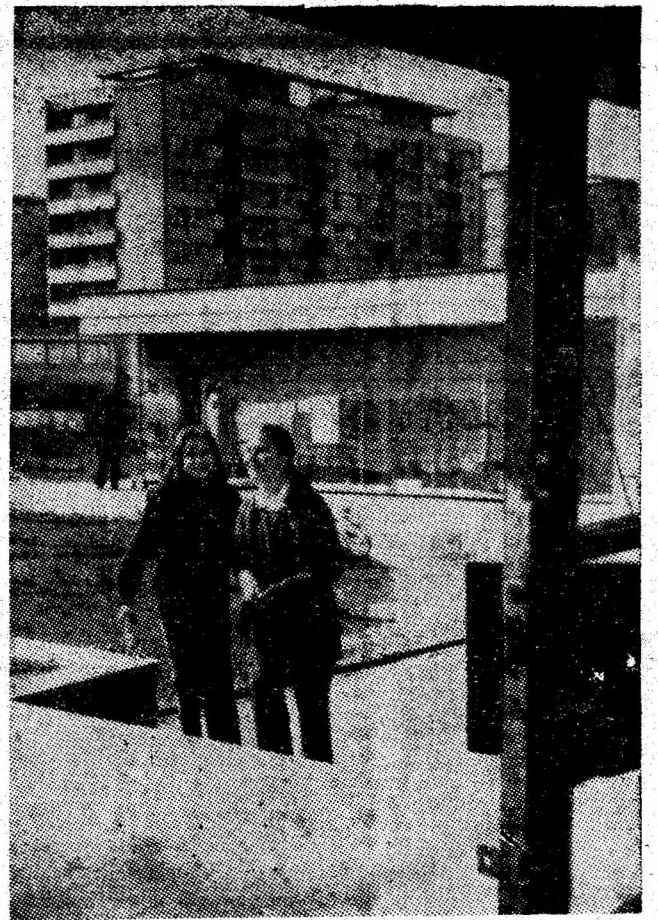
Moderne, atractive — iată atributele noilor cartiere ale Văii Jiului.

— Cerințe vizînd desfacerea legumelor și fructelor în orașul Lupeni. — Rubricile noastre : Cabinet juridic, Semne de întrebare, Răspundem