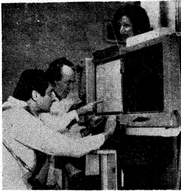
Secția de radiologie, dotată cu aparatură modernă, a spitalului municipal din Petroșani.