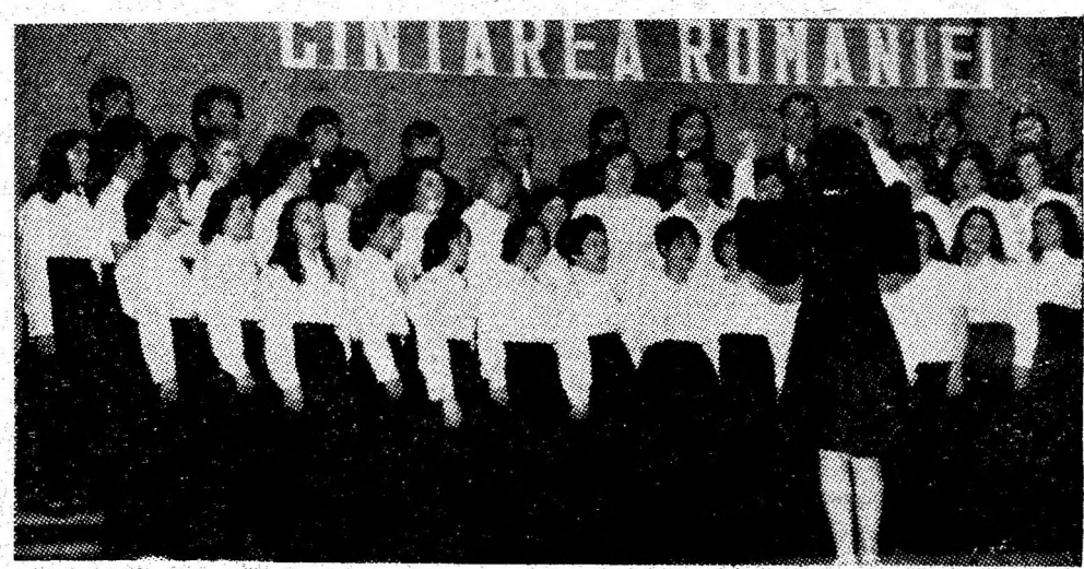
Corul mixt al I.F.A. Viscoza - Lupeni