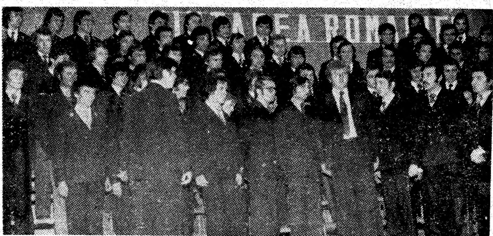
Corul studențesc al Institutului de mine Petroșani (facultatea de mine)