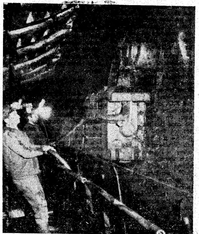
Unul din punctele cele mai „fierbinți” ale întrecerii minerilor din Petroșani pentru mai mult cărbune: abatajul dotat cu complex mecanizat de susținere în care lucrează ortacii unui cunoscut miner, promotor al tehnicilor avansate, șeful de brigadă Titu Teacenco.