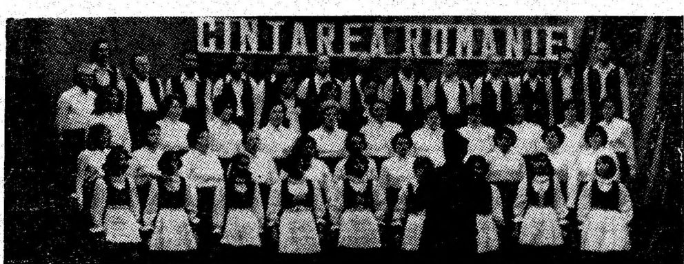
Corul mixt în limba maghiară al clubului din Vulcan.