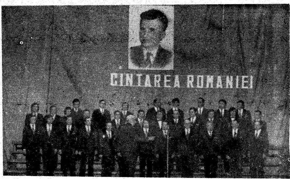
Corul bărbătesc al I.M. Lupeni