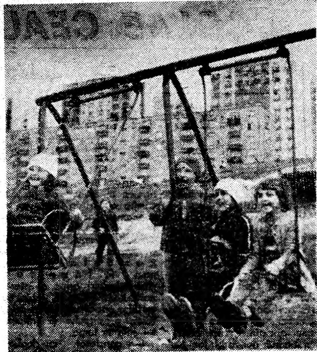
Fericirea și tinerețea zilelor noastre - copiii de azi - cunosc numai veselia și bucuria unei vieți noi. Sînt realități vii ale localităților Văii Jiului.