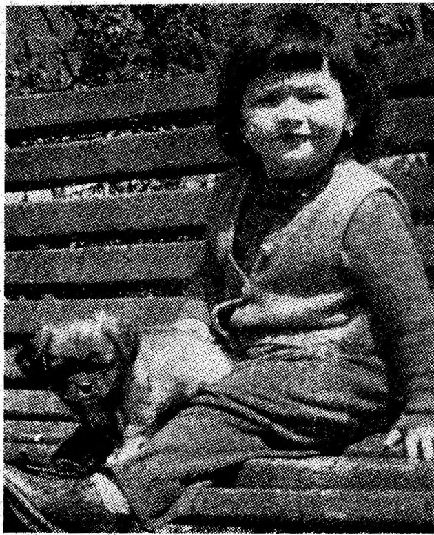
„Lizuca și Patrocle“.