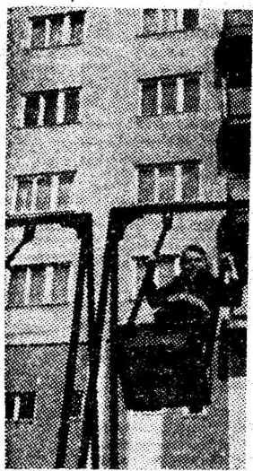
Soare și... voie bună în căterul Aeroport — Petroșani.