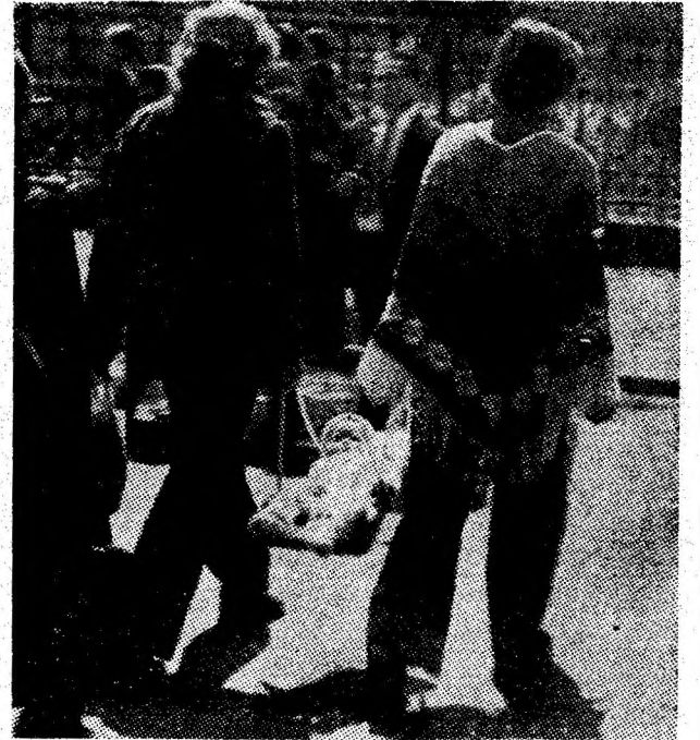
„Și pe stradă mă simt ca în... eșan”