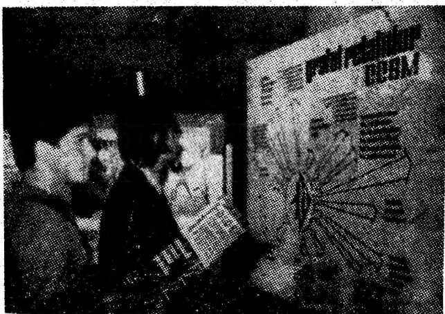
Aspect de la expoziția de protecție a muncii, deschisă în holul Casei de cultură din Petroșani.