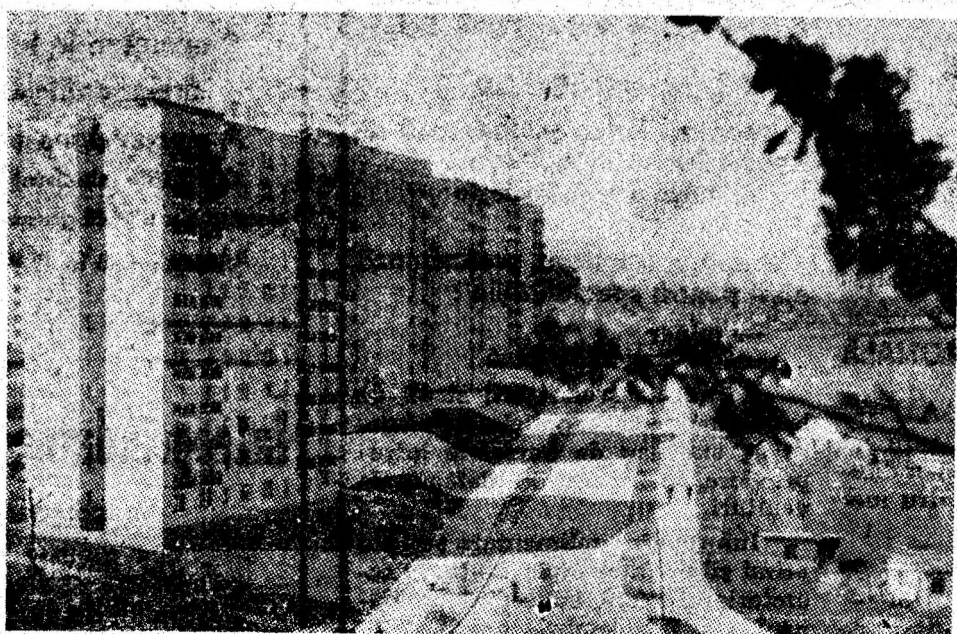
Dimensiunile contemporane ale Vulcanului. Obiectivelor industriale noi care apar pe harta orașului li se adaugă an de an impunătoare edificii social-culturale.