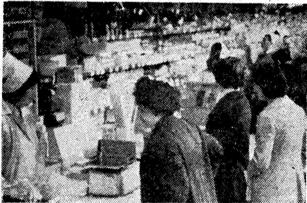
Bine aprovizionatul magazin alimentar din cartierul Bucur — Uricani cunoaște zi de zi afluența cumpărătorilor.