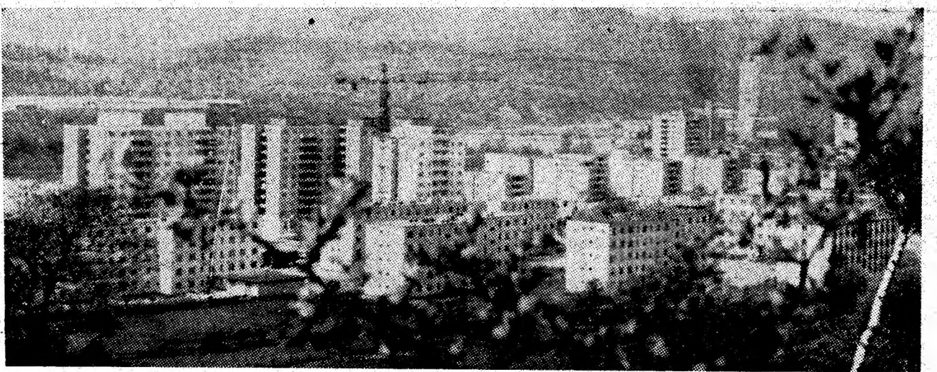
Util și frumos, făurit de oameni pentru oameni - cartierul Aeroport - Petroșani.

Cu acest prilej, conducerea oficiului informează pe cei interesați că în cadrul unității funcționează serviciul de sesizare a deranjamentelor - 02, la care pot fi anunțate afi deranjamentele de la domiciliile abonaților telefonici și a avariei de genul celei semnalate în ziar.