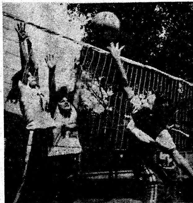
Duminică, fotoreporterul nostru a „șomat” la faza municipală a Daciadei, fiind silit să aleagă din fototecă o imagine, care să illustreze măcar amintirea unor întreceri la fileu...