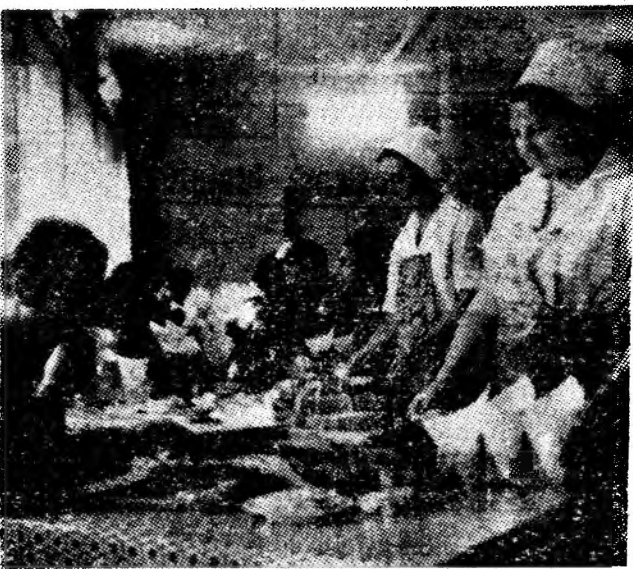
Cantina minei Lupeni. Poți bună la o mincare gustoasă!

Cutremurul nu a fost resimțit în București. Nu s-au produs pagube materiale.